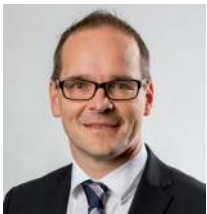
Grant Hendrik Tonne Niedersächsischer Kultusminister

Auf dieser Grundlage werden Sie eine fundierte Entscheidung für den weiteren Bildungsweg Ihres Kindes treffen können. Ein glückliches Kind, das den Anforderungen der gewählten Schulform motiviert begegnet, sollte das gemeinsame Ziel sein.